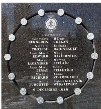
Plaque commémorative installée à l'entrée principale de l'École Polytechnique

Puis, le drame de celles dont le nom apparaissait sur la liste du tueur fou qui ne faisait que commencer son oeuvre selon les pièces recueillies dans ses affaires. Plusieurs autres féministes ont échappé à ce massacre parce que